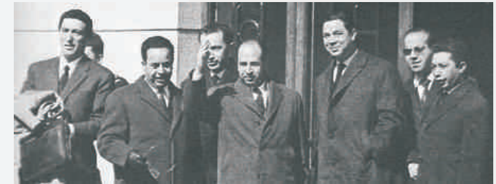
Délégation du GPRA