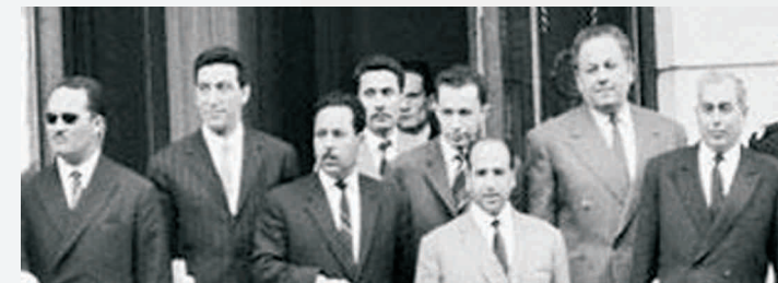
Délégation du GPRA